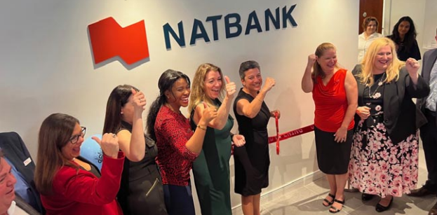
Cette photo : l'inauguration de Natbank à Naples en 2024

Avenue, répondant aux besoins croissants de la communauté francophone établie sur la côte ouest.