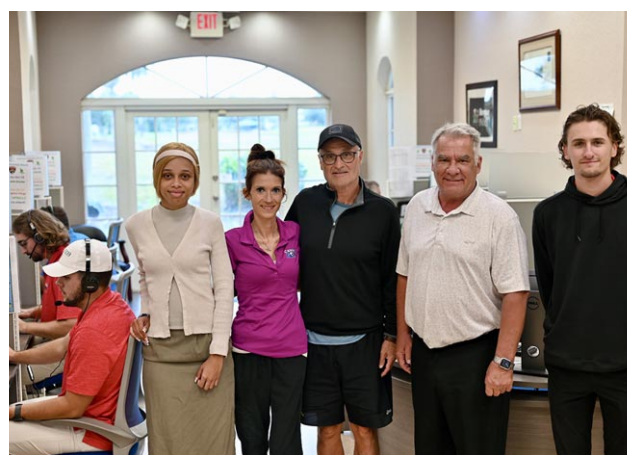
Une (toute petite) partie de l'équipe de Canam Golf

Au-delà du golf, Canam Golf offre également l'accès à des billets pour les événements sportifs et spectacles les plus réputés de Floride. L'inscription au service permet de recevoir des informations sur les der-